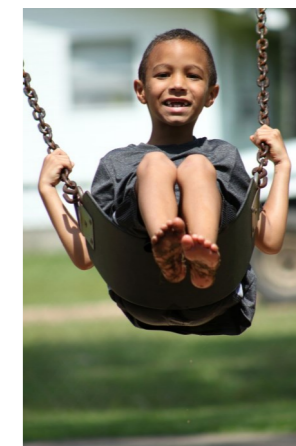
Vini palé di nou timour

Depuis donc 12 ans, l'accompagnement de ce public a évolué en Guyane. Il faut rappeler l'implication de nombreux acteurs locaux, en particulier les porteurs de projets associatifs. Mais il reste encore des avancées à réaliser.