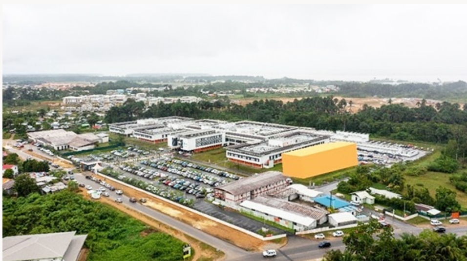
En jaune, le futur bâtiment qui abritera l' EHPad et le SMR

L'ARS et la CTG ont sécurisé 80 % des financements nécessaires pour reconstruire l'établissement, toujours situé dans l'ancien hôpital André-Bouron et peu adapté à la prise en charge des personnes âgées dépendantes. Il sera reconstruit sur l'emprise actuelle du Chog à l'horizon 2028. L'opération sera concomitante à la construction de l'unité de SSR de 30 places. Une réunion sur le sujet s'est tenue mercredi à la sous-préfecture de Saint-Laurent du Maroni.