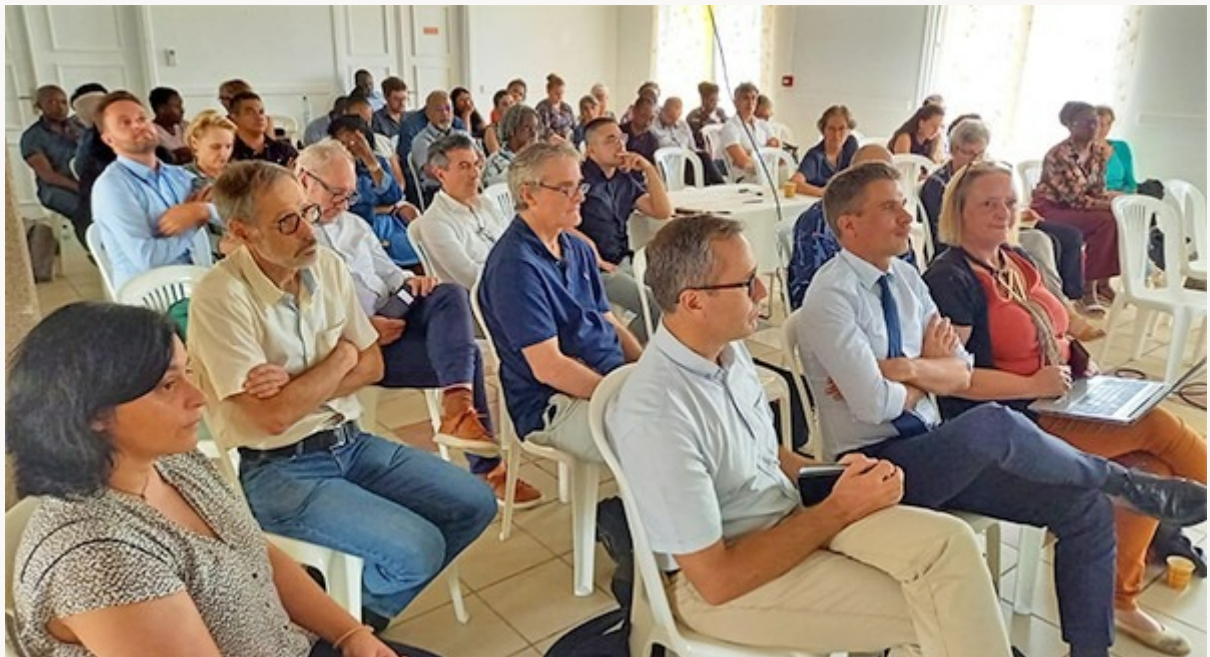
CHRU - Echanges avec professionnels des trois hôpitaux publics de Guyane en juillet à Sinnamary

Dans un an doit être signée la convention de création du futur Centre Hospitalier Régional Universitaire de Guyane.