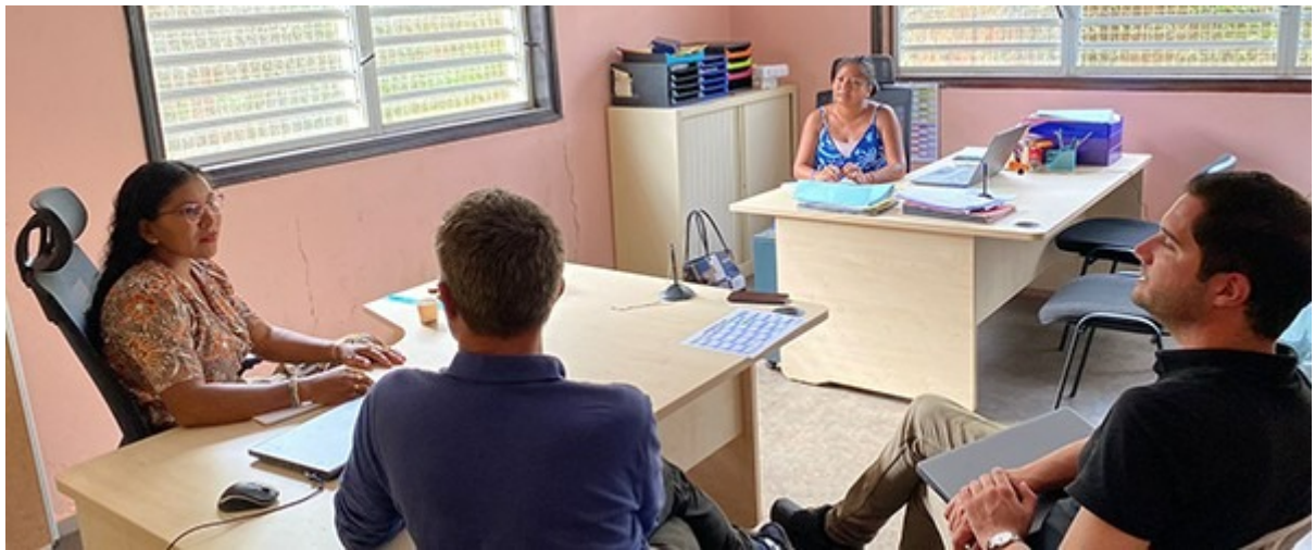
Mairie de Camopi