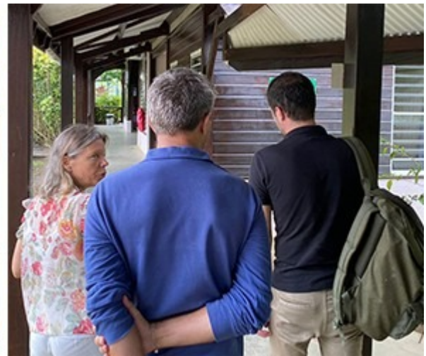
Sous-préfecture de Saint-Georges de l'Oyapock et collège de Camopi