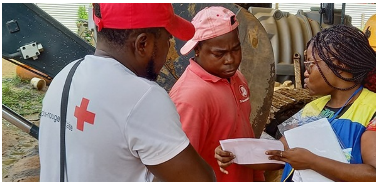
Médiateurs lors d'une action d'information sur le paludisme, en juin à Matoury

Une structure régionale doit voir le jour dans un an, pour renforcer la coordination des acteurs de la médiation en santé.