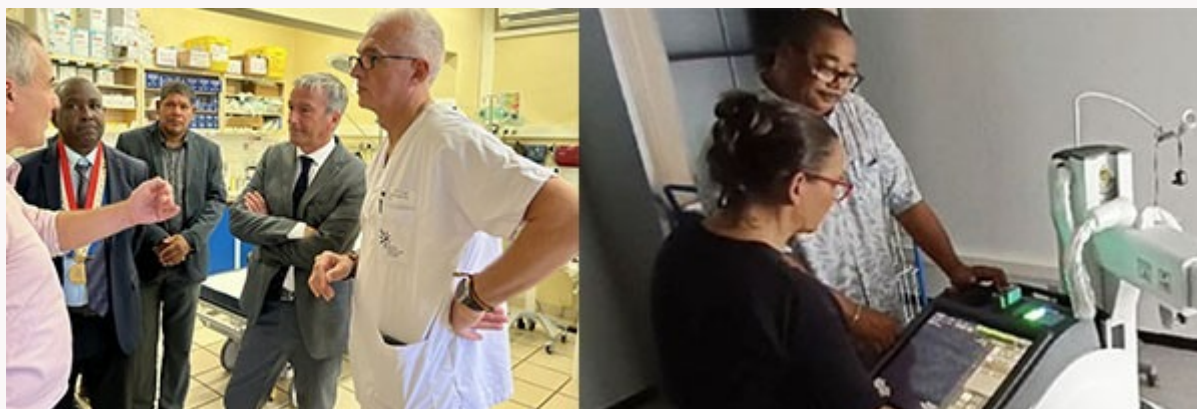
Hôpitaux de proximité de Saint-Georges de l'Oyapock et Grand-Santi

Les hôpitaux de proximité sont créés. Les trois centres délocalisés de prévention et de soins (CDPS) de Maripasoula, Grand-Santi et Saint-Georges ont reçu le label d'hôpital de proximité mi-avril. Celui de Saint-Georges est inauguré mi-septembre par le ministre délégué aux Outre-mer,