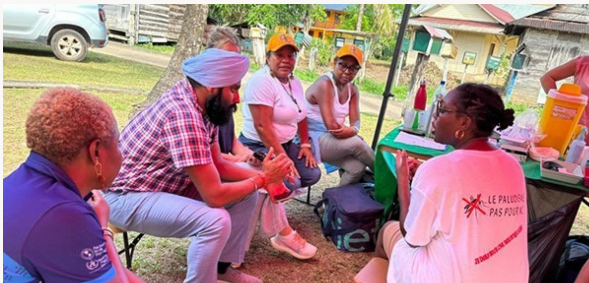
Les responsables de l'Organisation Panaméricaine de la Santé (OPS/Paho) à Régina

La fin d'Air Guyane. Le 29 septembre, ce qui était impensable se produit : Air Guyane, la seule compagnie aérienne qui desservait régulièrement les communes de l'intérieur, est liquidée. L'épilogue de nombreux mois de difficultés. Dès le 12 mai, la Lettre pro s'inquiétait de l'arrêt des livraisons de médicaments à la pharmacie de Maripasoula. Plus jamais le service ne reprendra normalement, à partir de là. L'entreprise est placée en liquidation judiciaire le 2 août avec poursuite d'activité pendant deux mois. La fin d'Air Guyane impacte le fonctionnement des CDPS et des hôpitaux, mais aussi de l'HAD Rainbow, de l'officine de Maripasoula et de la Croix-Blanche, ainsi que les missions de l'ARS en matière de contrôle de la qualité de l'eau de consommation et d'enquêtes environnementales. Les hélicoptères et les avions des sociétés privées, ainsi que les pirogues sont sollicités. Jusqu'à la décision du 29 septembre. Face à l'impossibilité d'une reprise d'activité rapide, l'inquiétude se fait jour pour les patients chroniques ayant reporté leurs rendez-vous sur le littoral, ce qui amène l'ARS à financer à son tour des heures de vol pour les hôpitaux. Dans le même temps, la Collectivité territoriale (CTG) lance une procédure d'urgence. Une nouvelle compagnie est désignée début décembre, pour sept mois. Un nouvel appel d'offres sera lancé en début d'année.