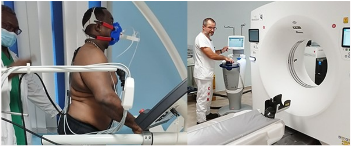
CHK : équipements cardiologie et nouveau scanner

Le CHK développe son activité d'HDJ... Cette année, le Centre Hospitalier de Kourou a ouvert des hôpitaux de jour en cardiologie et infectiologie, après celui de diabétologie en 2022. La cardiologie s'est aussi dotée d'équipements neufs pour les tests d'effort. Une unité de douleurs thoraciques a également vu le jour au premier trimestre, pour garantir un bilan rapide aux personnes arrivant aux urgences.