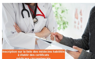
Inscription sur la liste des médecins habilités à établir des certificats médicaux circonstanciés

Le service civil du parquet de Cayenne recherche des médecins pour l'établissement de certificats médicaux circonstanciés. Dans le cadre des attributions du parquet, le service civil traite des signalements de personnes majeures vulnérables pour lesquelles l'ouverture d'une mesure de protection (sauvegarde de justice, curatelle, tutelle) se révèle nécessaire. Cette mission est particulièrement importante puisqu'il s'agit d'assurer la